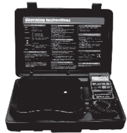
98210 - A