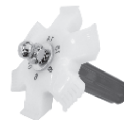
TLFC6 CH 351