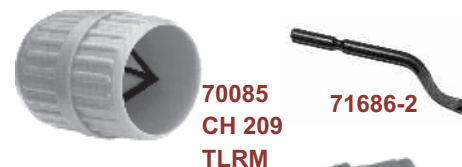
70085 CH 209 TLRM

Diseñado para eliminar fácilmente rebabas internas. Incluye una cuchilla de tungsteno de recambio para un uso prolongado